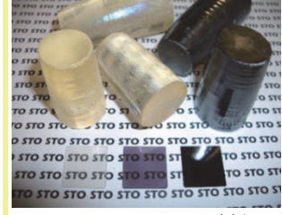
▲SrTiO 3 基板