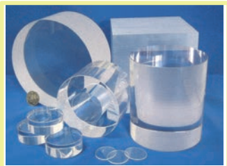
▲サファイア加工製品